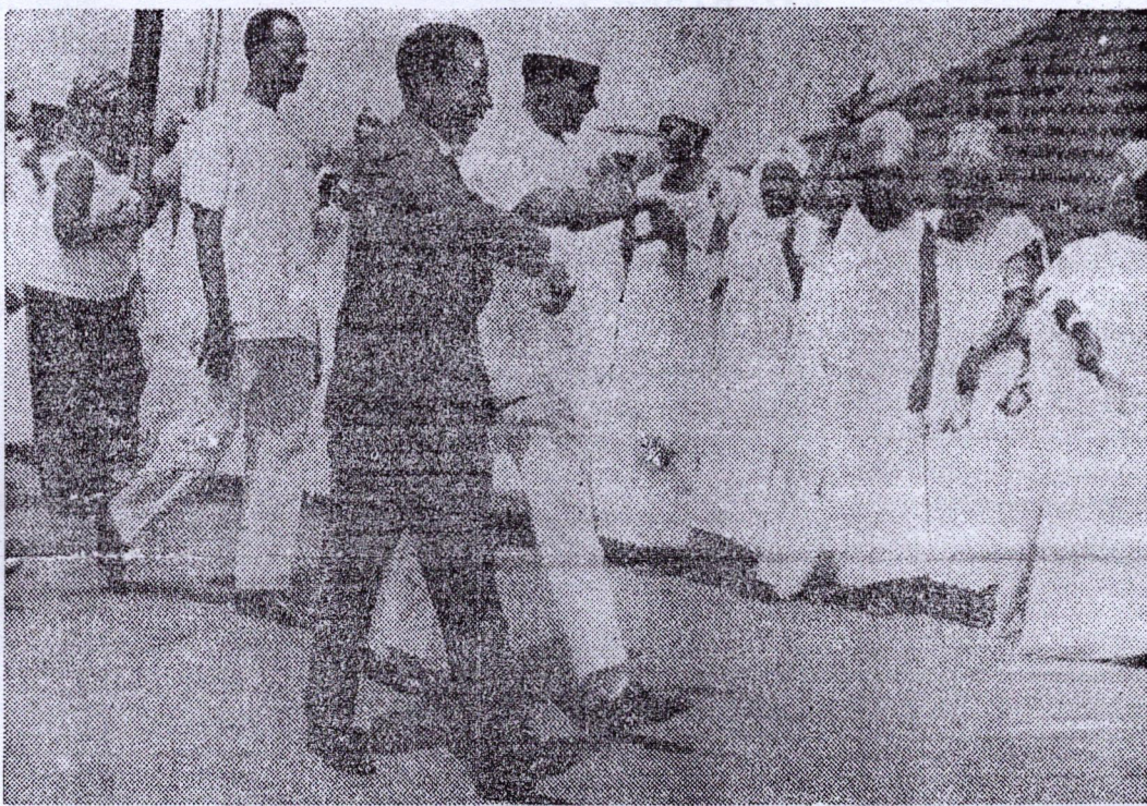
Les deux frères de combat Alphonse Massemba-Débat et Ahmed Sékou Touré répondant aux saluts des militants.

Le 1er février 1968, le peuple de Guinée a réservé un accueil des plus fraternels, des plus militants au Président de la République du Congo Brazzaville, S.E.M. Alphonse Massemba-Débat.